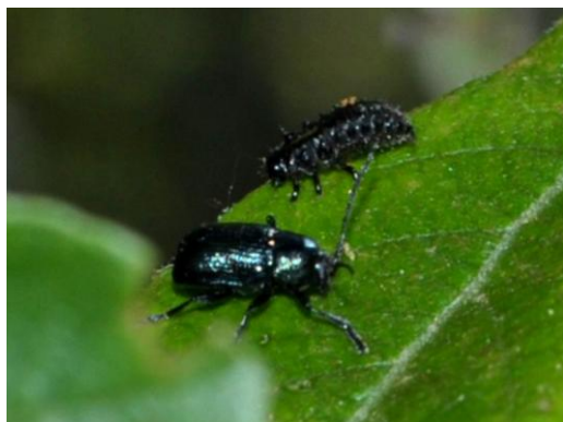
Fig. 3. C. androgyne y larva de P. versicolora en libertad.