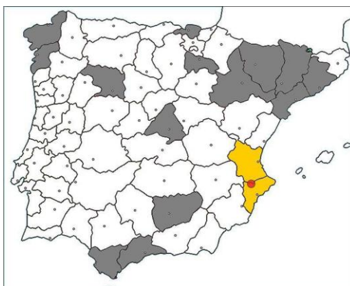
Fig. 4. Distribución ibérica.

Petitpierre, E., 1980. Catàleg dels coleòpters crisomèlids de Catalunya, I. Cryptocephalinae. Butlletí de la Institució Catalana d'Història Natural , 45 : 65-76.