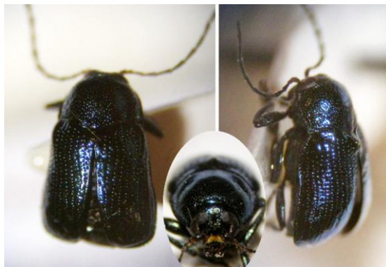
Fig. 1. Hábitus de Cryptocephalus androgyne .